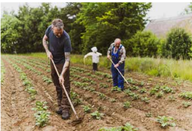
Text und Bilder: Landkreis Hof