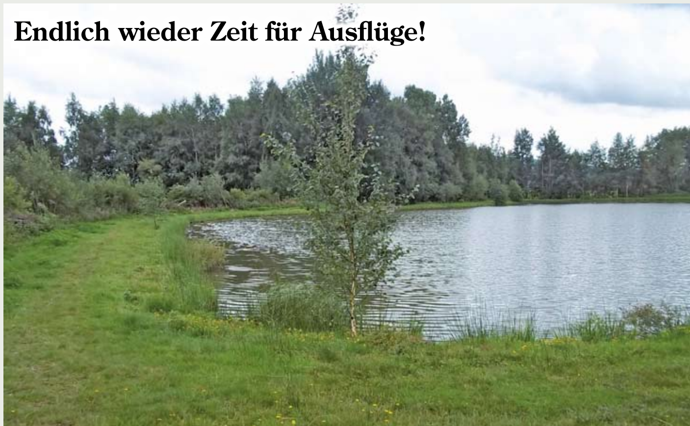
Weiher bei der Zigeunermühle